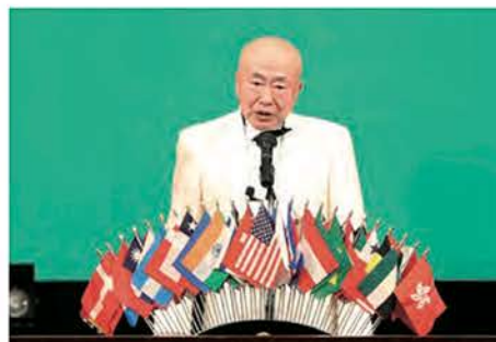
開会宣言 鷹嶋地区ガバナー