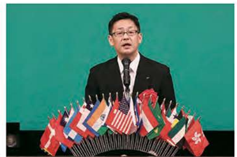
平木省静岡県副知事 祝辞