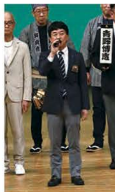
横川泰之 次期キャビネット会計