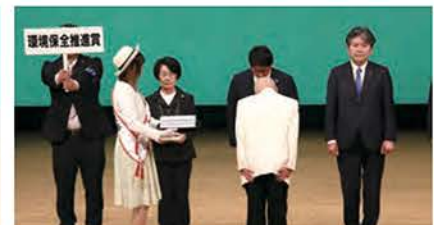
環境保全推進賞（5クラブ）