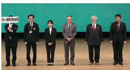
小児がん・糖尿病対策推進賞（5クラブ）