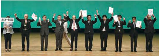
地区ガバナー特別賞（1ゾーン・3クラブ）