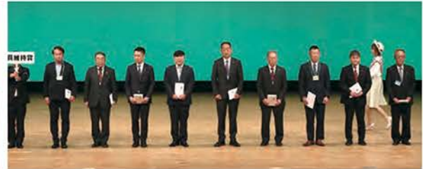
会員維持賞（9クラブ）