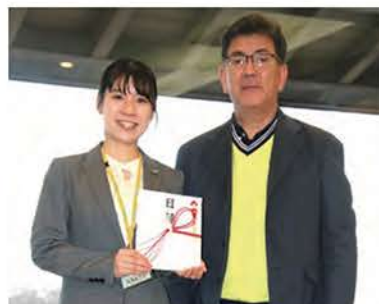
日本盲導犬協会・富士ハーネスへの寄付