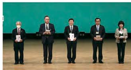
LCIF・クラブ寄附賞（5クラブ）