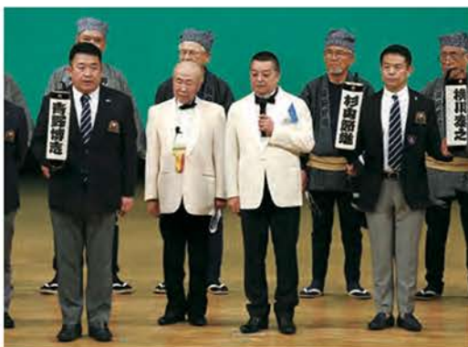
青野博志 次期キャビネット幹事