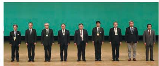
マーケティング賞（1ゾーン・4クラブ）