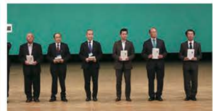
献眼・献腎・献血運動推進賞（6クラブ）