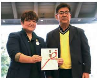
静岡県聴覚障害者協会への寄付