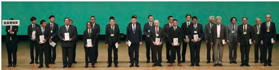
会員増強賞（23クラブ）