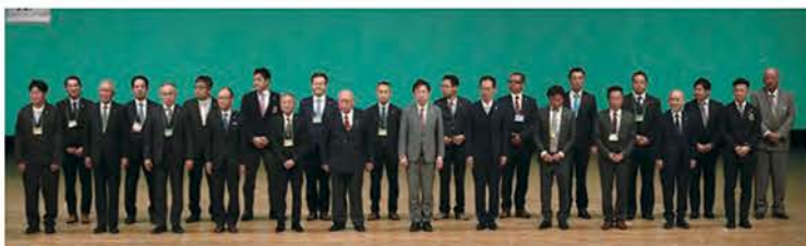
身近な奉仕賞（24クラブ）