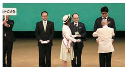
クラブ会報・ホームページコンテスト（3クラブ）