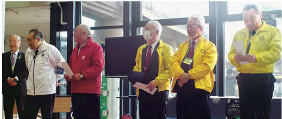
ホスト3R3ZのZCと5クラブ会長