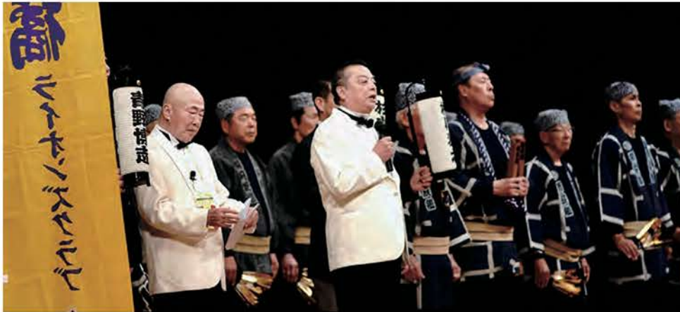
杉山節雄ガバナーエレクト