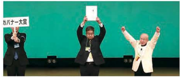
地区ガバナー大賞（富士宮LC）

地区ガバナー基本方針に沿って顕著な活動を展開したクラブに贈られた年次表彰は、地区ガバナー大賞をはじめとして15賞が2ゾーン・108クラブに贈られました。