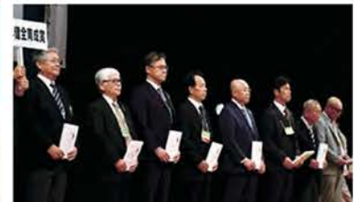
青少年健全育成賞（8クラブ）