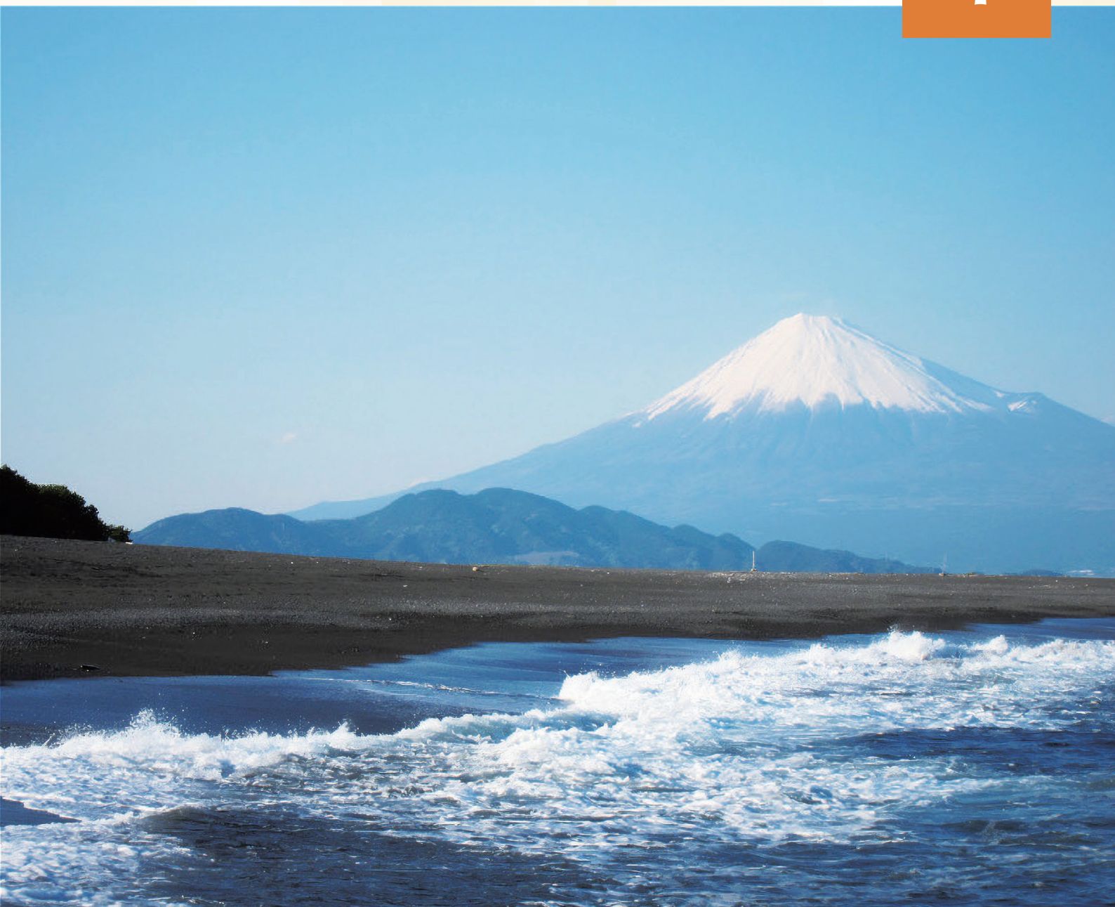
Photo: 静岡市清水区 三保海岸