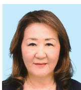
2Z 磐田 飛田 紗有李 まずは 「人間を創れ 魂を磨け」