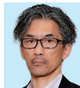
藤 枝 大石 晴久 共に考えよう! 奉仕の意義と クラブの価値