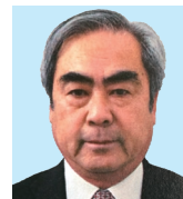
島 田 平野 積 友愛と奉仕