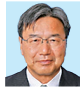
清 水 高木 強 楽しんで We Serve!