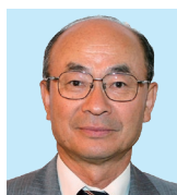
1Z 沼津中央 三島時政 五事を正す (貌言視聴思) まずは貌より