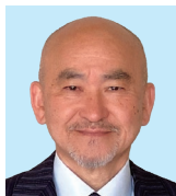
蒲 原 若山 誠治 ひろげよう奉仕 つなげよう心