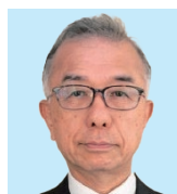
沼津香陵 松井泰樹 50 th anniversary & renovation