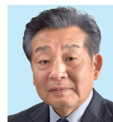
静岡巽 浅場 雅樹 ネットワークを拡充し、 巽に新しい風を