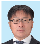
湖西 小池 六法 奉仕を楽しもう