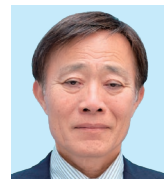
焼 津 石野 豊 温めよう60年の歴史、 深めよう絆