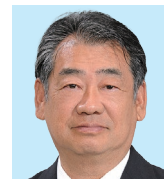
藤 南 鷺坂 雄二 感謝55周年、 次なるステージへ 今こそ絆を深めよう