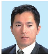
WYPT・ 小児がん対策委員 藤 南 今野 英明 天行は健なり君子は 以て自ら強めて息ます