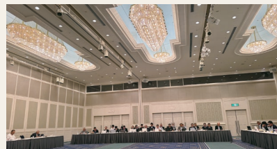
キャビネット会議会場