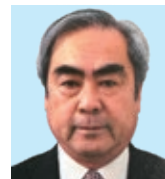
島 田 平野 積 友愛と奉仕