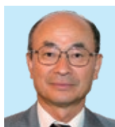
1Z 沼津中央 三島時政 五事を正す (貌言視聴思) まずは貌より