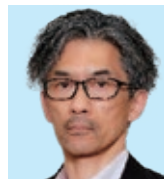
藤 枝 大石 晴久 共に考えよう! 奉仕の意義と クラブの価値