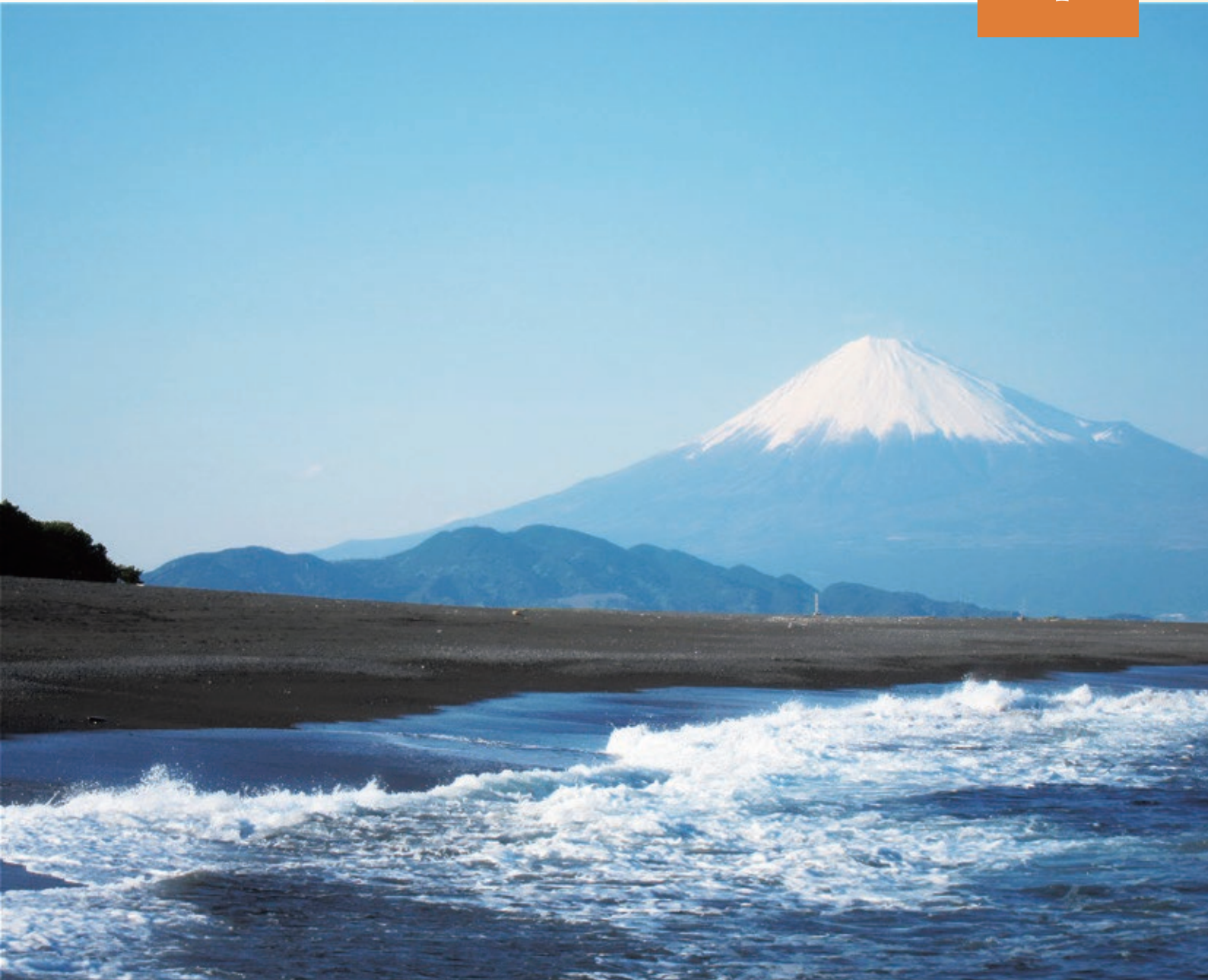
Photo: 静岡市清水区 三保海岸