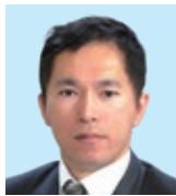
WYPT・ 小児がん対策委員 藤 南 今野 英明 天行は健なり君子は 以て自ら強めて息ます