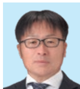
湖西 小池 六法 奉仕を楽しもう