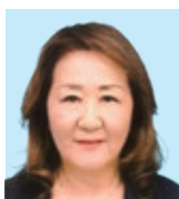
2Z 磐田 飛田 紗有李 まずは 「人間を創れ 魂を磨け」