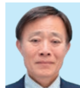
焼 津 石野 豊 温めよう60年の歴史、 深めよう絆