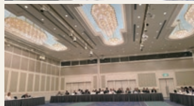
キャビネット会議会場