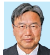
清 水 高木 強 楽しんで We Serve!